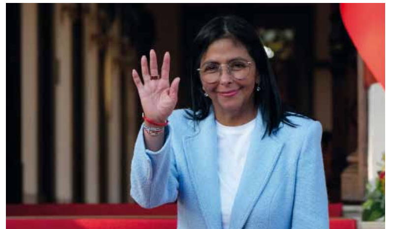
Futuro viaje. La mandataria venezolana podría visitar Estados Unidos en un tiempo no tan lejano.

“Les puedo asegurar que estoy a cargo de la presidencia de Venezuela, como lo establece cla-