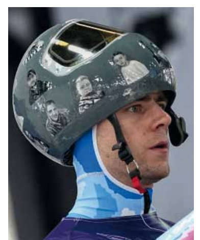
Casco. LLevaba fotos de atletas asesinados por Rusia.

El COI alegó que la expulsión de la competición se había adoptado ante la negativa del atleta ucraniano,