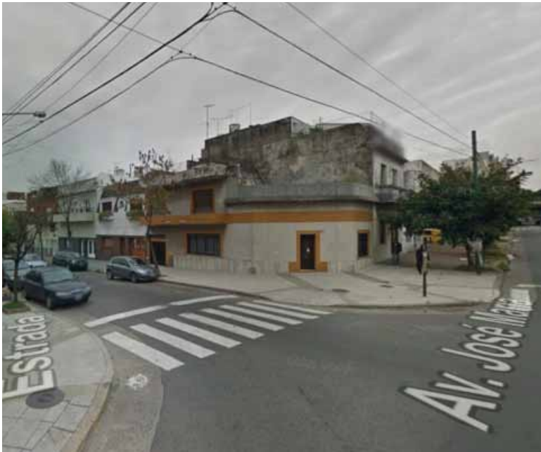
Botín. Los delincuentes se llevaron dólares, objetos de valor y alimentos.

Durante casi tres horas, los jubilados fueron sometidos a golpes en la cara y en distintas partes del cuerpo, además de amenazas constantes. Uno de los asaltantes llegó a advertirles que les cortaría los dedos si no colaboraban. También les dijeron que volverían en caso de que avisaran a la Policía, en un claro intento de amedrentamiento. Los delincuentes escaparon con una importante suma de dóla-