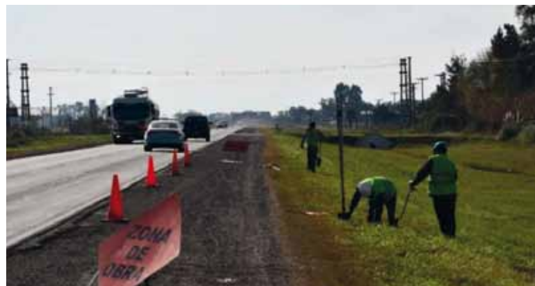
Destino. El 60% de lo recaudado irá Consejo Escolar del Partido, para infraestructura, equipamiento y funcionamiento.

Es en la Ruta Provincial 65. Las autoridades municipales estiman que se podrían sembrar unas 300 hectáreas.