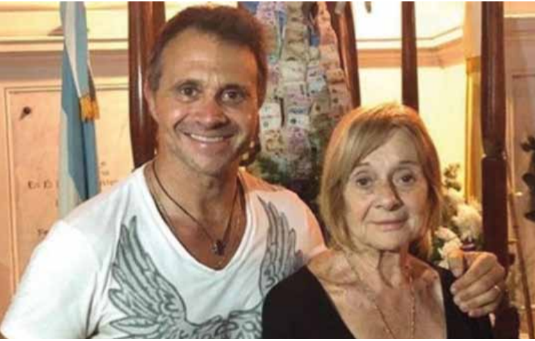
Detalles. El periodista contó cómo fue el violento robo que sufrió su mamá.

Los delincuentes ingresaron por el garaje a su casa en Banfield, redujeron a las mujeres que asisten a la mujer de 90 años que sufre Alzheimer.