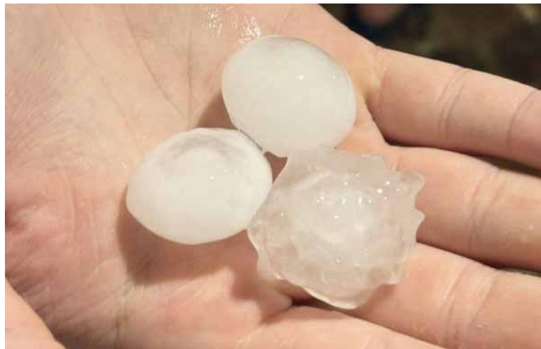
Gran tamaño. Uno de los puntos donde más se sintió la granizada fue en la localidad de Pilar.

Uno de los puntos donde más se sintió la granizada fue en la localidad de Pilar, donde usuarios de X compartieron videos que mostraban el tamaño de las piedras y la fuerza con la que impactaban. En La Matanza y José C. Paz también reportaron actividad eléctrica, lluvia fuerte y granizo de menor tamaño.