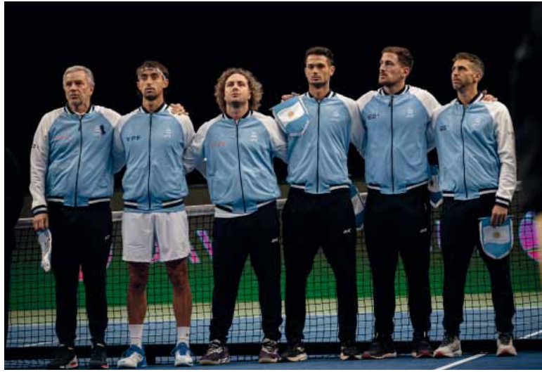
Alivio. Argentina vuelve a ser local después de cuatro series.

Turquía, por su parte, viene de ganarle como visitante por 3-1 a Eslovenia, en una serie que