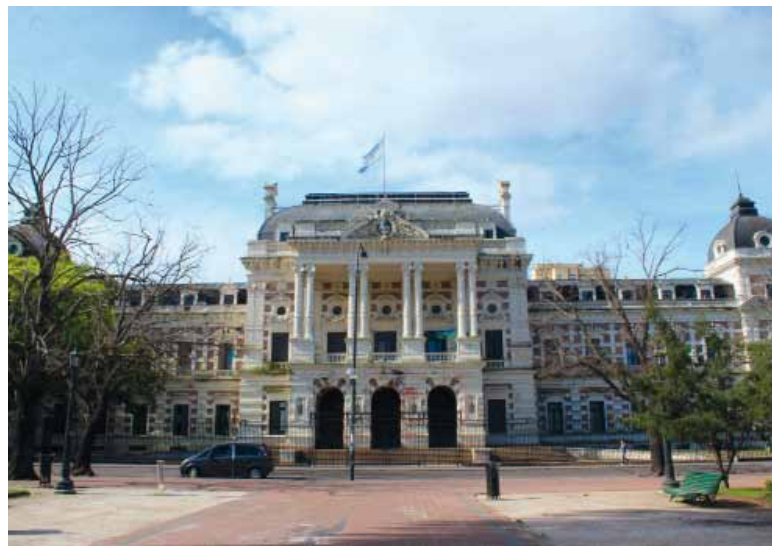
Adverso. Kicillof advirtió que no tiene mucho margen para mejorar el ofrecimiento debido al "complejo contexto fiscal" que atraviesa.

El Gobierno afirmó que el mes pasado los estatales cobraron un 4,5% más que en diciembre, pero los gremios advierten que eso ocurre porque se otorgaron dos retroactivos por un total del 1,5% que ya no se cobran más. Por eso, ahora afirman que el aumento ofrecido ayer en realidad mantiene ese 1,5% y le suma un 1,5% más, por debajo de la inflación de enero que fue 2,9%.