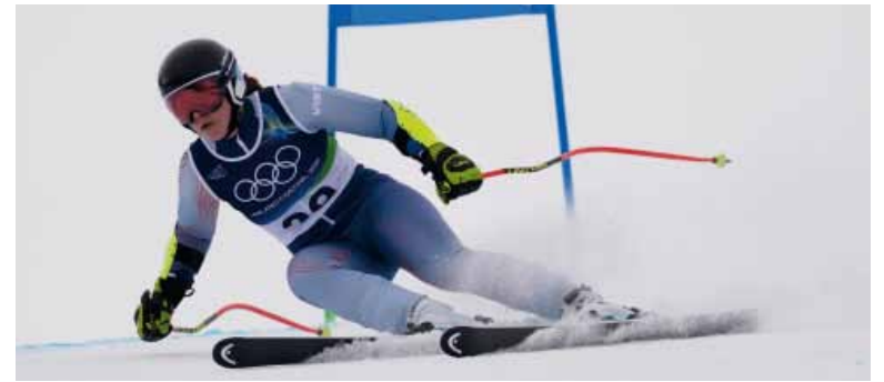
Enfocado. Con solo 19 años, Begué ratificó su proyección tras destacarse también en descenso y en la prueba combinada por equipos.

La esquiadora argentina finalizó 22ª en la prueba de esquí alpino en los Juegos Olímpicos de Milano-Cortina 2026, el mejor resultado de un sudamericano en la especialidad.