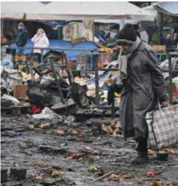
Gente camina por un mercado destruido en Odesa.

Ataques rusos dejan sin calefacción a miles de edificios en Ucrania