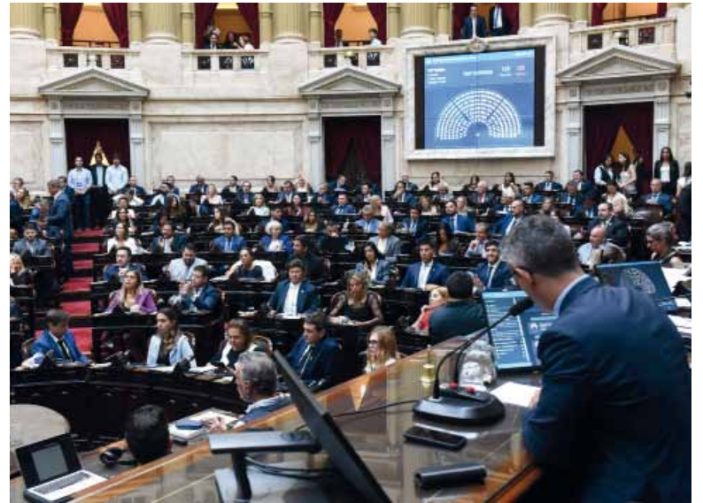
En racha. La Cámara de Diputados fue escenario de un nuevo triunfo político para el Gobierno.