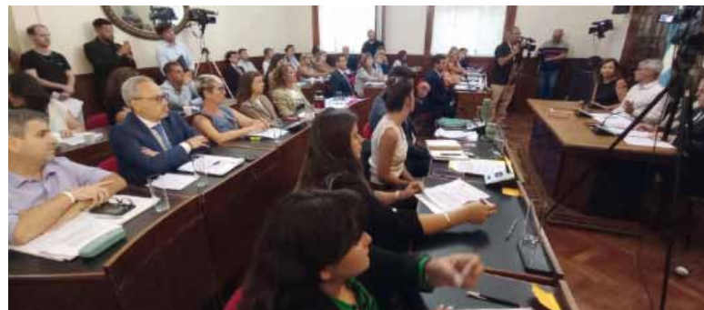
Inédita. Fue la sesión que se desarrolló a manera de homenaje en la Universidad Nacional del Sur.

En otro tramo del documento, los ediles destacaron que “la conmemoración de los 70 años