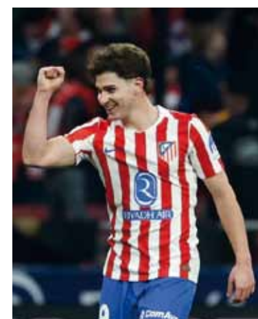
Sequía. El 9 argentino llevaba 16 partidos sin convertir.

En el complemento, Hansi Flick movió el banco y buscó otra cara, incluso con el ingreso de Robert Lewandowski. Hubo un gol anulado por VAR y algunas aproximaciones, pero el trámite fue más equilibrado y sin impacto en el resultado. Atlético, sólido y confiado, administró la ventaja y hasta rozó el quinto.